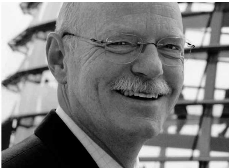
Dr. Peter Struck

Vorwort des ehemaligen SPD-Fraktionsvorsitzenden Dr. Peter Struck aus der Erstauflage der Broschüre „Otto Wels - Mut und Verpflichtung“ (2008).