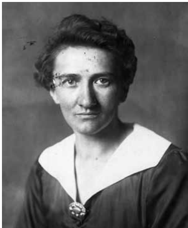
Toni Pfülf um 1920

In ihrer Biografie der sozialdemokratischen Reichstagsabgeordneten Antonie Pfülf 1 schildert Antja Dertinger 2 die Ereignisse des 23. März von der Sitzung der SPD-Reichstagsfraktion im Reichstag bis zur Abstimmung über das „Ermächtigungsgesetz“ in der Kroll-Oper.