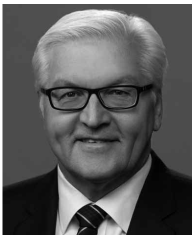
Dr. Frank-Walter Steinmeier