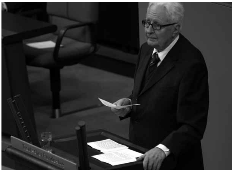
Dr. Hans-Jochen Vogel

Dr. Hans-Jochen Vogel in der Gedenkstunde zu „Die Zerstörung der Demokratie in Deutschland vor 75 Jahren“ des Deutschen Bundestages am 10. April 2008.