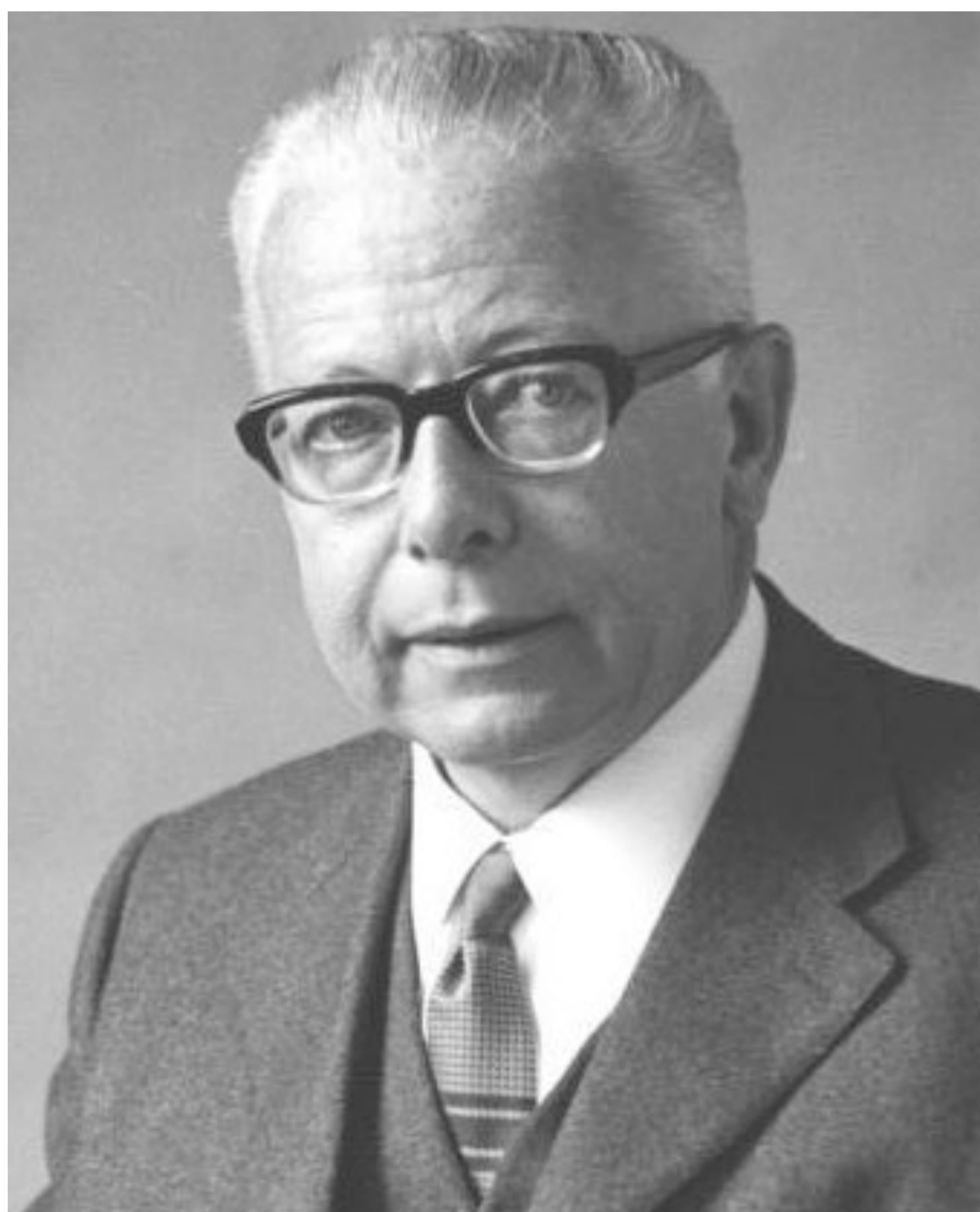
Gustav Heinemann Bundespräsident 1969 - 1974

Die siebziger Jahre werden auch als das Jahrzehnt der Sozialdemokratie in Deutschland bezeichnet. Mit Gustav Heinemann hatte Deutschland einen Bundespräsidenten, der die Bürgerrechte in den Mittelpunkt seiner Reden und Bemühungen stellte, und sich intensiv um den Dialog mit der rebellischen Jugend bemühte.