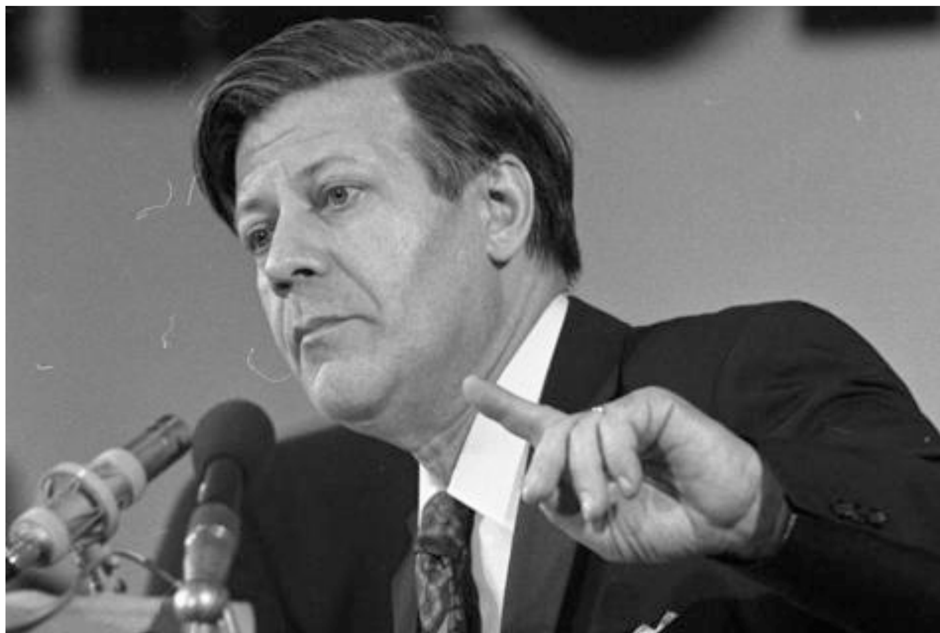
Helmut Schmidt Bundeskanzler 1974 - 1982

In die Regierungszeit von Helmut Schmidt fällt die Zeit des Terrors der Rote Armee-Fraktion.