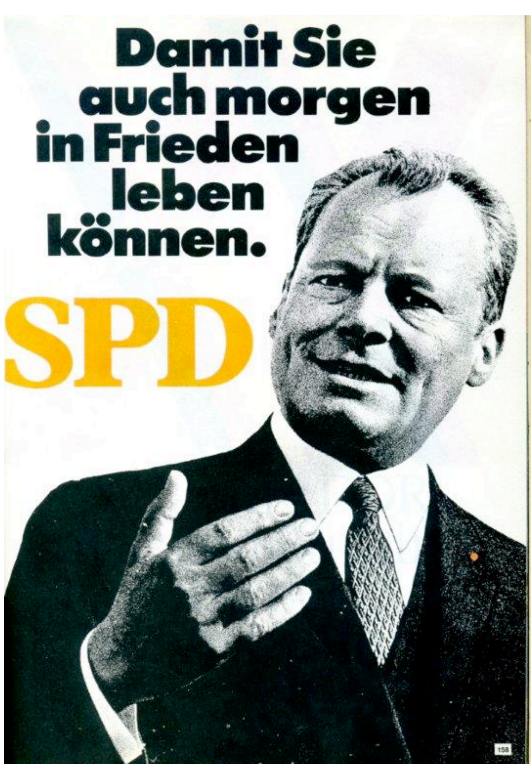
Willy Brandt Bundeskanzler 1969 - 1974

In der 1. großen Koalition wurde Willy Brandt Außenminister (1966 - 1969). Die Außenpolitik wurde nun neu ausgerichtet. Zusätzlich zu der Zusammenarbeit mit dem Westen wurde nun besonders die Verständigung mit dem Osten forciert. Ziel war die Deutsche Einheit und bestimmte nun die Politik der Sozialdemokraten unter der charismatischen Persönlichkeit Willy Brandts.